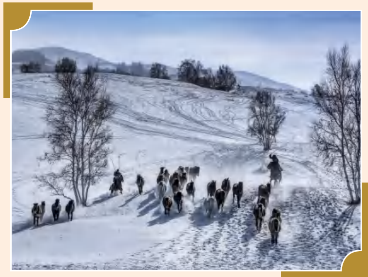
《策马扬鞭自奋蹄》